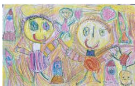
Zuzana Slezáková, 5 r., Môj vesmír