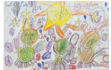
Lívia Balluchová, 5 r., Mimozemšťania